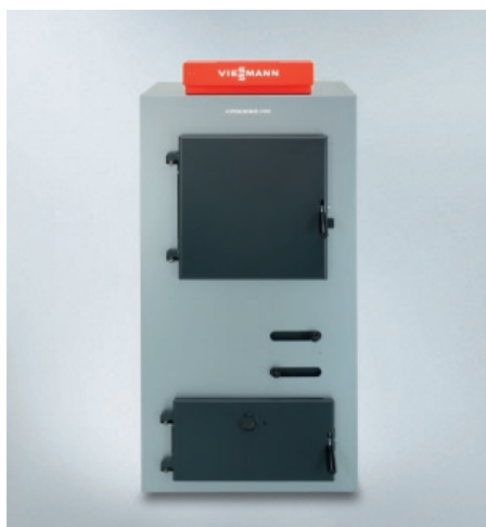
Koksnes gāzes ģenerācijas katls Vitoligno 100-S