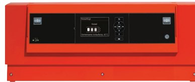
Kaskādes regulēšanas sistēma Vitotronic 300-K

Matrix cilindra tipa degli ar nerūsējošā tērauda Matrix audumu raksturo ilgs kalpošanas mūžs. Iebūvētā sadegšanas regulēšanas sistēma Lambda Pro Control Plus automātiski pielāgo degšanas procesu, mainoties gāzes veidam. Tas nodrošina augstu energoefektivitāti un rada drošību par rītdienu liberalizētā gāzes tirgus apstākļos, kā arī biogāzes piemaisījumu gadījumā. Lambda Pro Control Plus nodrošina nelielus apkopes izdevumus, jo skursteņslauķa veicamo pārbaužu intervāli pagarinās līdz trīs gadiem.