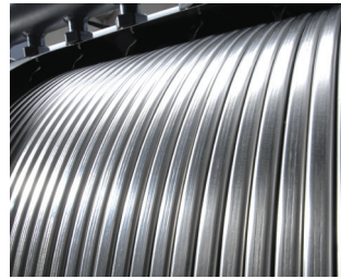
Inox radiālais siltummainis no nerūsējošā tērauda

Kaskādes regulēšana notiek ar jauno vadības sistēmu Vitotronic 300-K. Atklātā teksta displejs un grafiskais displejs garantē augstu lietošanas komfortu. Pēc vēlēšanās, izmantojot Vitogate 200, apkures sistēmu var iekļaut arī ēkas automatizētajās sistēmās.